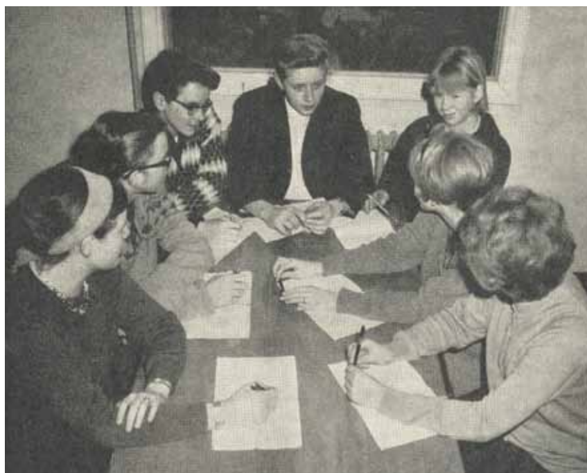
Sønderkærskolen i Hvidovre var et af de første steder, hvor et elevråd blev oprettet.

Denne diskussion – altså om magtfordelingen mellem skoleledere, lærere, forældre, kommunen og staten – er den røde tråd i fortællingen om Skole og Forældres historie. I