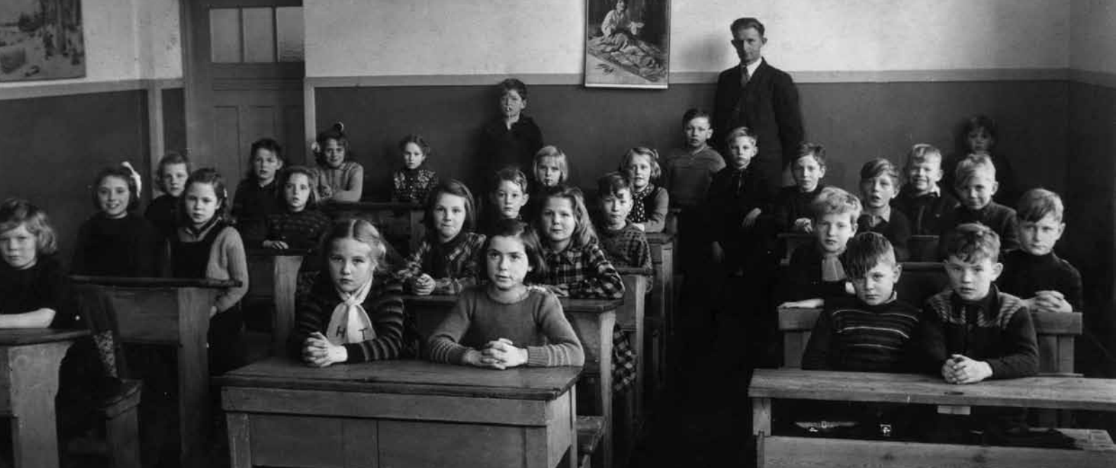
Spørgsmålet om disciplin og pryglestraf var længe centralt for forældrene og deres forening. Billedet er fra 1944.

› var de obligatoriske og fik større beføjelser, især på de sociale forhold i skolen. Det blev startskuddet til Forældrerådernes Landsforening, som fra 1934 udgav månedsbladet Forældreråds-Tidende. Foreningen holdt sit første møde på Hindsgavl i juni 1935, og man understregede i ord og toner, at foreningens mål var samarbejde og ikke konfrontation. ”Loven lukker nyt Land op for Forældrene, og Mødet paa Hindsgavl viste Offentligheden Forældre fra alle Landets Egne, fra alle Lejre, fra Købstæder og Landsogne, opfyldte af Vilje til at trænge ind i dette Nyland og tage det i Besiddelse, ikke som en fremstormende Skare, der sanseløst trænger paa, men som alvorlige, besindige Mænd og Kvinder, der ved, at man skal fare med Lempe, hvor Barnets Velfærd skal drøftes.”