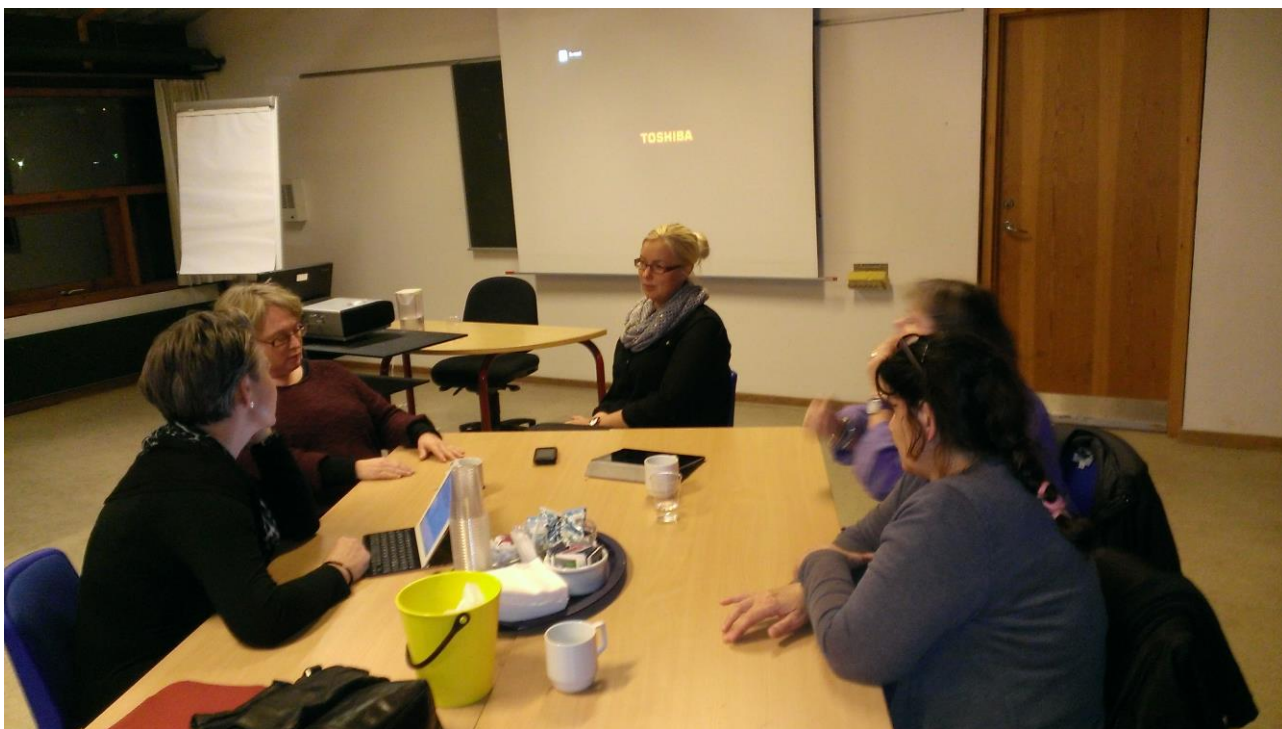
Kursus for lærere