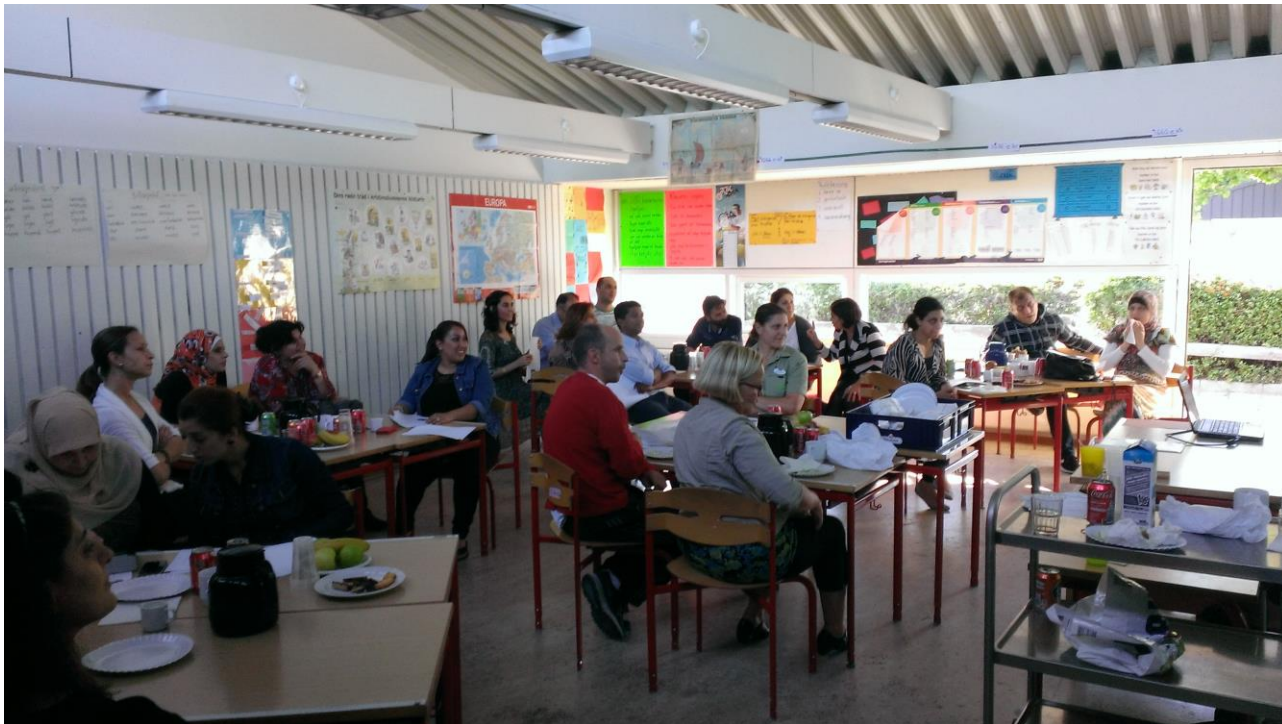
Kursus for forældre på Damagerskolen