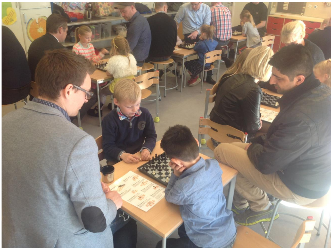
Eksemplarisk forældre/elev aktivitet med skakspil på Mosedeskolen

”Udvikling af samarbejdet mellem skole og nydanske forældre” samarbejdsprojekt mellem Greve Kommune og Skole Forældre i perioden 2013-2015. Udarbejdet af Jens Tovgaard, juni 15.