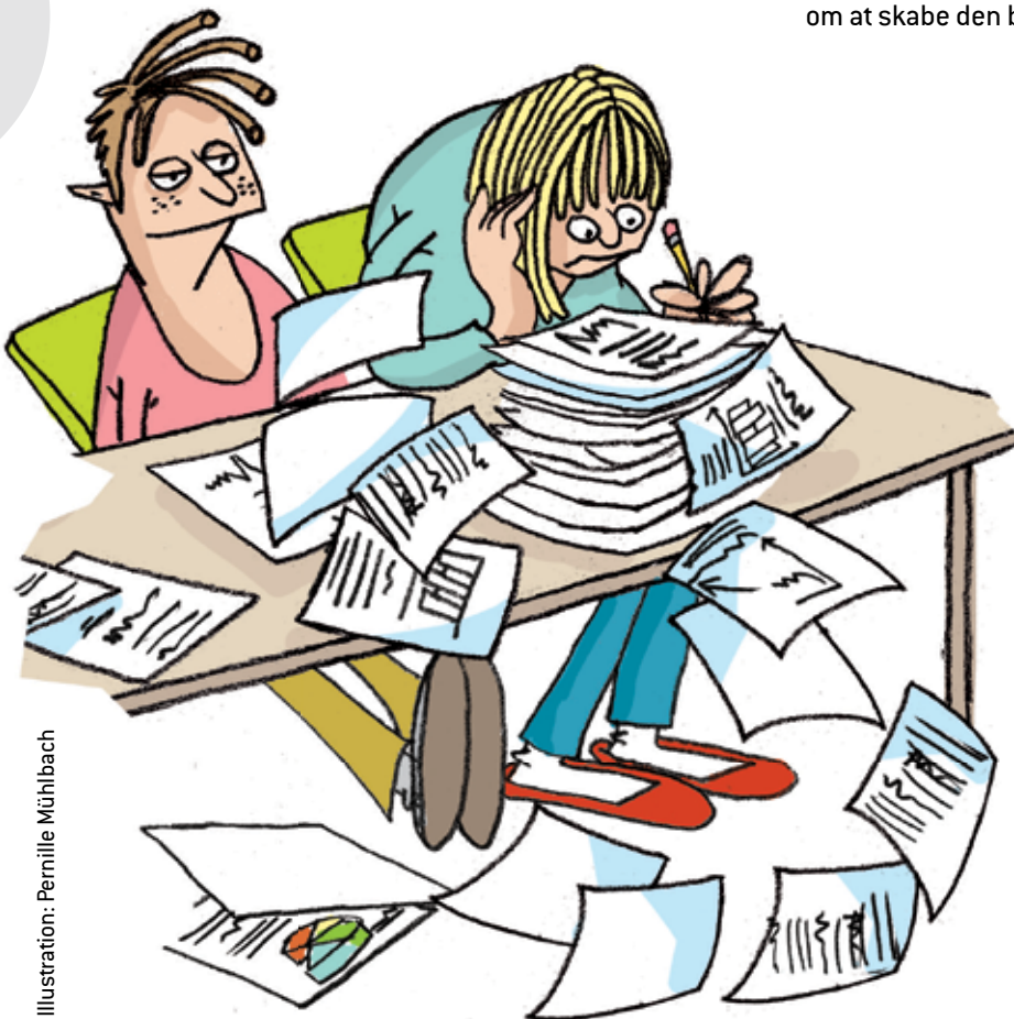
Illustration: Pernille Mühbach

Det er sjældent befordrende for arbejdet for elevernes bedste, at der er konflikt. Man bør derfor så vidt muligt søge veje til fælles forståelse eller kompromis, for at kunne koncentrere sig om at skabe den bedste skole for eleverne.