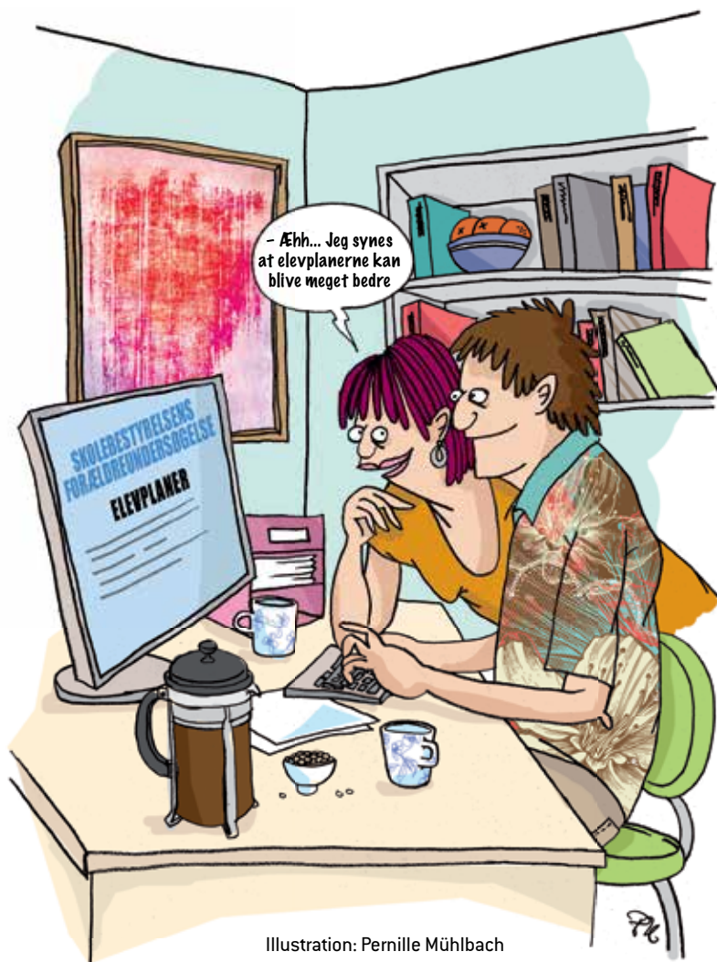
Illustration: Pernille Mühlbach

Endelig viser en undersøgelse 1 fra Skole og Forældre, at skolebestyrelser, der fører systematisk tilsyn, har større indflydelse på skolens virke.