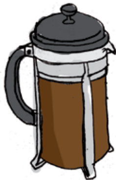
Illustration: Pemille Mühlbach

Bertel Haarders brev vedrørende personsager