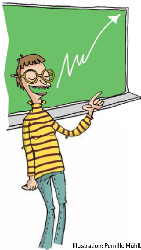
Illustration: Pernille Mühlbach