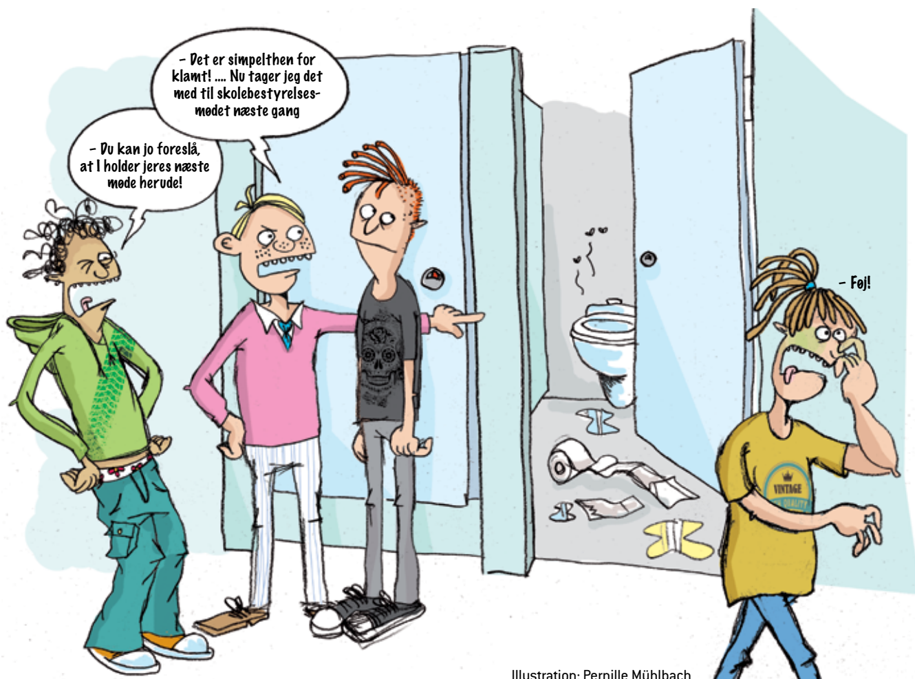
Illustration: Pernille Mühlbach